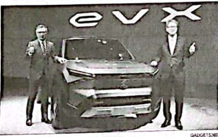
CANGGIH : Suzuki meluncurkan mobil full listrik pertamanya di India.

JAKARTA - Kendaraan listrik semakin populer dari hari ke hari. Tidak hanya menarik minat merek-merek baru, tetapi juga perusahaan-perusahaan mapan yang telah memproduksi mesin pembakaran internal selama bertahun-tahun. Termasuk Suzuki, salah satu raksasa otomotif Jepang ini sekarang mulai serius memikirkan masa depan mobil listriknya. Hal ini ditunjukkan dengan Maruti Suzuki, cabang India dari Suzuki Motor Corp, meluncurkan Concept eVX, sebuah SUV full listrik pertama.